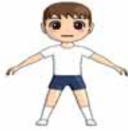
たいいくぎ 体育着