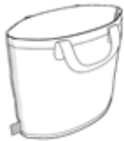
て ぶくろ 手さげ袋