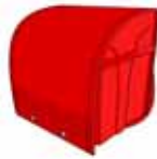
らんどせる ランドセル